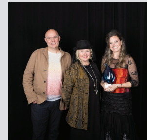
Art & culture La Factrie