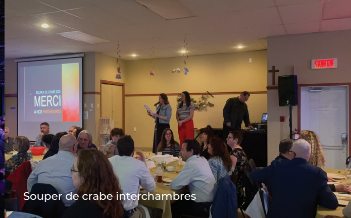
Souper de crabe interchambres

En 2025, la page Facebook a généré 334,1 K vues, 11,3 K visites, 2,9 K clics sur les liens et 3,3 K interactions avec le contenu. La croissance la plus marquée provient des clics sur les liens, avec une hausse de 121,9 %.