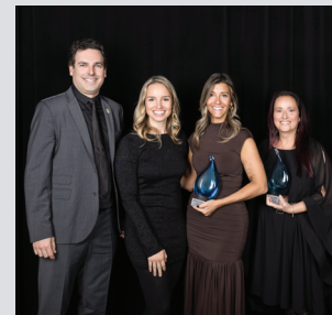
Mention spécial du Jury INH-Allaire Maison Olivier Shawinigan