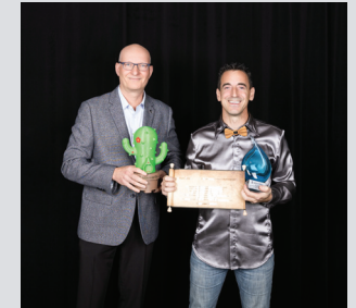
VERT L'Avenir La bü-verte