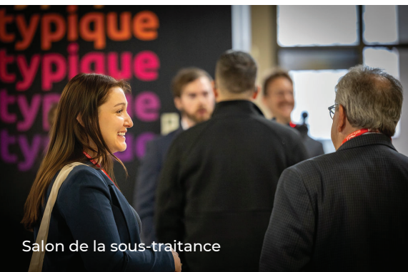
Salon de la sous-traitance