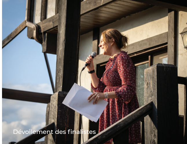
Dévoilement des finalistes