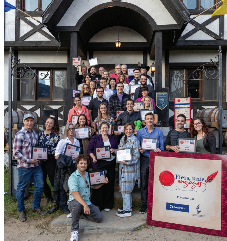
Le dévoilement des finalistes