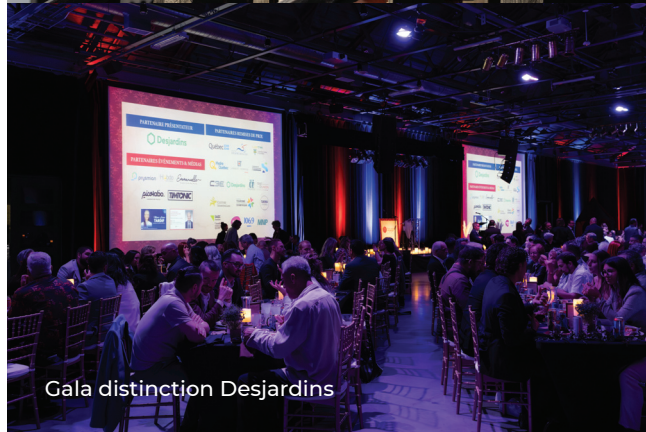
Gala distinction Desjardins