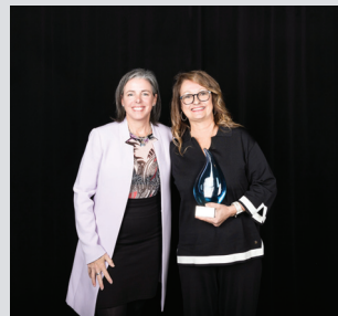
Pratique innovante Service de gestion documentaire France Longpré