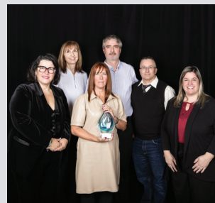
Engagement & impact social Rexforêt