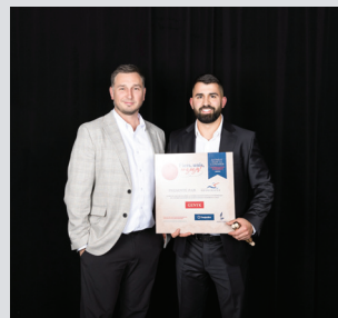
Diversification économique Genyk