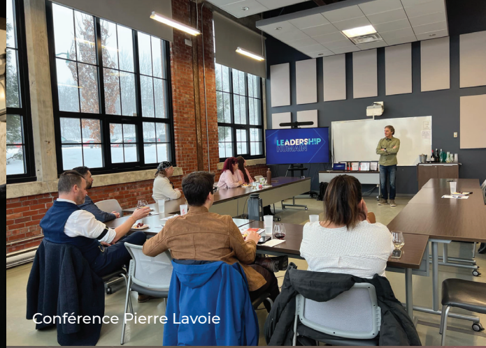
Conférence Pierre Lavoie