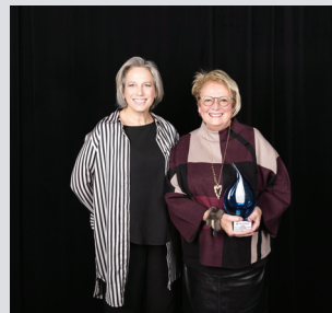
Tourisme La Cité de l'Énergie