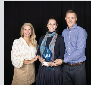
Démarrage & relève Clinique Laferté