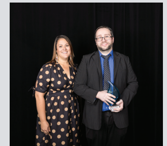
Diversité culturelle ARM