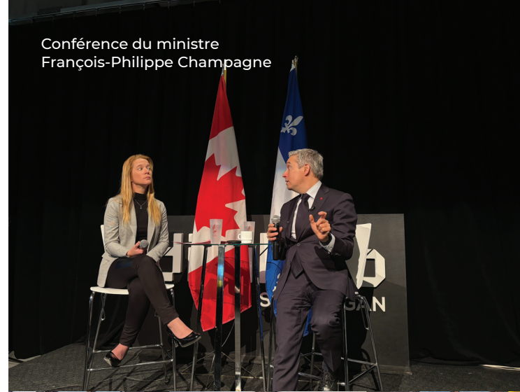
Conférence du ministre François-Philippe Champagne