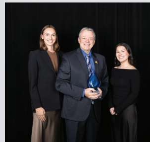
Expérience client Les Cataractes de Shawinigan