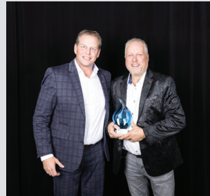
Investissement Protection incendie Péri-Tech