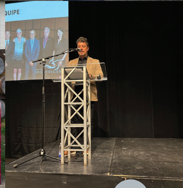
Bilan du maire